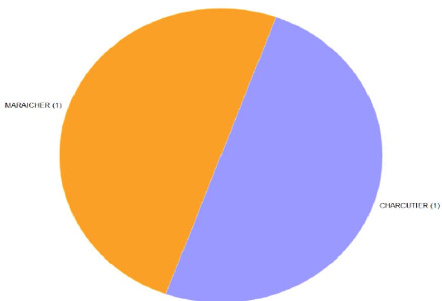
VERNON VERNONNET-2021-Répartition par Activité