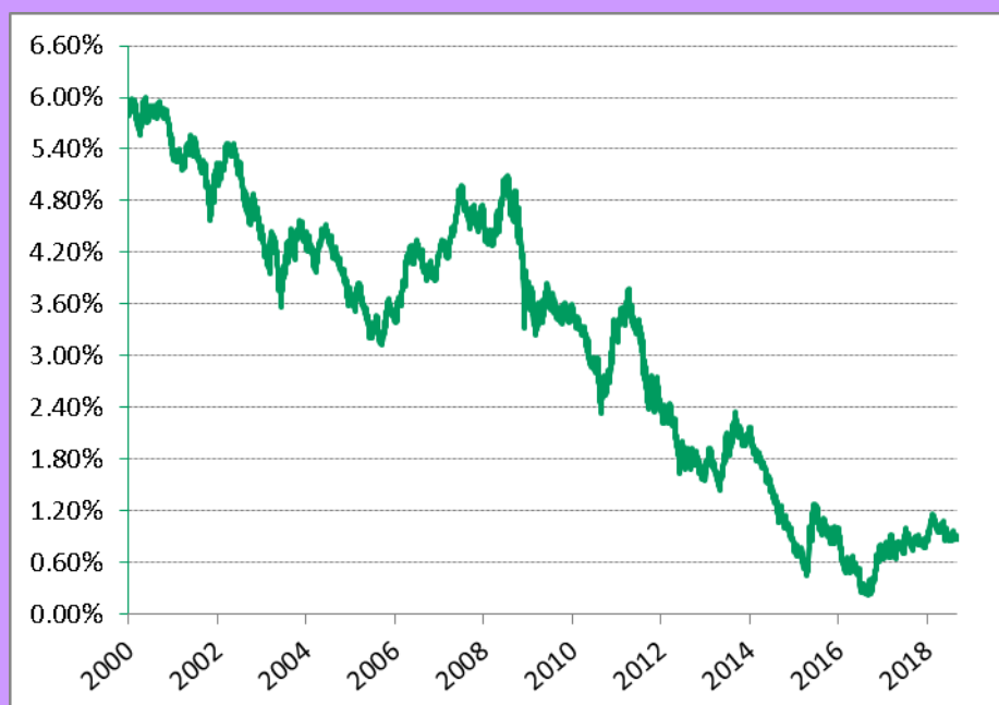
Historique des taux longs depuis 1999 (référence : CMS 10 ans, source : Reuters)

Dernier connu : 0,91% le 15/11/2018 - Source : Reuters